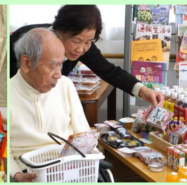
北海道ですって。これ買います?