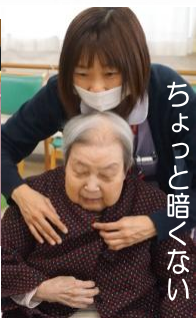
ちょっと暗くない