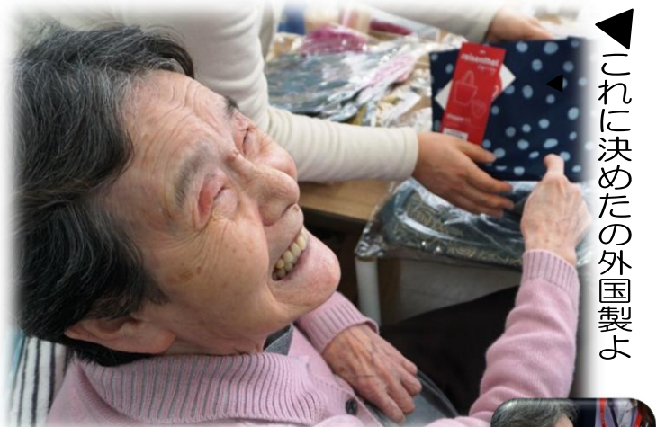
これに決めたの外国製よ

今すぐ着られる春物ウェア、スラックス、下着、パジャマ、靴下からバッグ、アクセサリ類の小物やお菓子、ご飯に合うふりかけなどが所狭しと並べられご家族と一緒にあれこれ悩みながら皆さん買物を楽しんでいました。