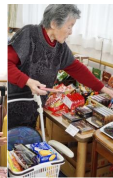
カゴはもう一杯ですよ。