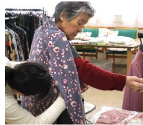
サイズどうかしら?