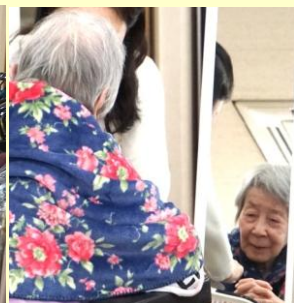
迷っちゃうのよいつも