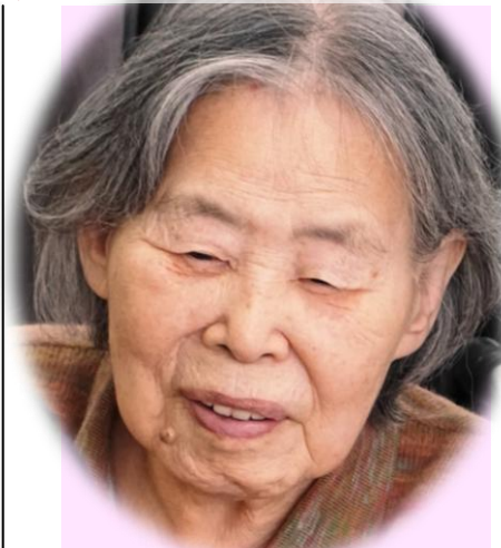
久しぶりの買物なの