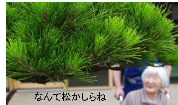
なんて松かしらね