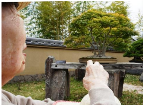
▲あそこの傍に行きたい