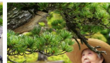
▲いいもの見られたよ