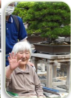
▲こっちだって入り口は！