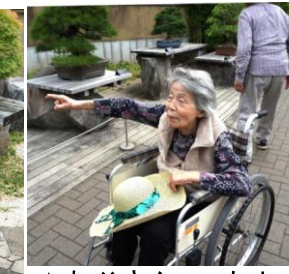
▲お父さんこっちよ！