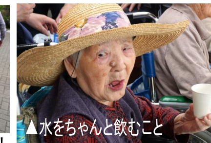
▲水をちゃんと飲むこと