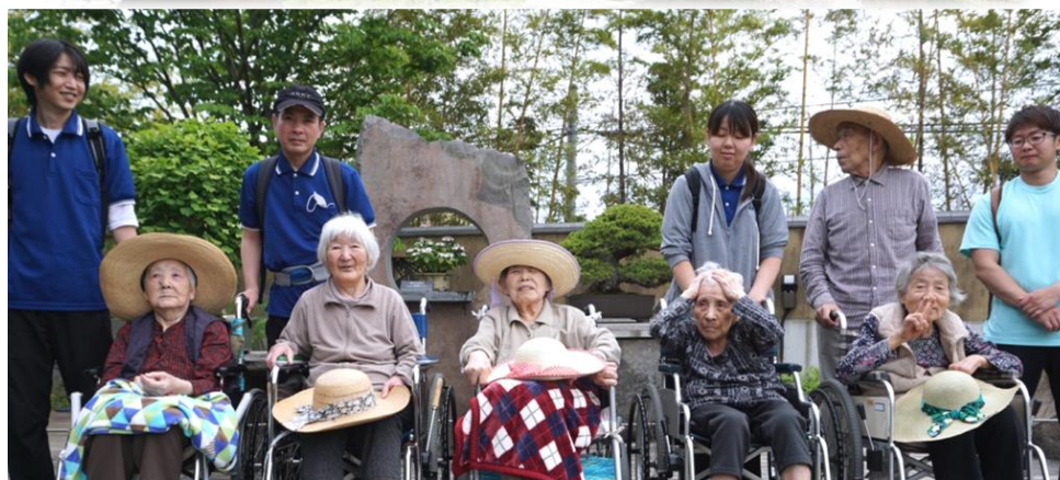
▲皆さん揃いましたか。はいポーズ