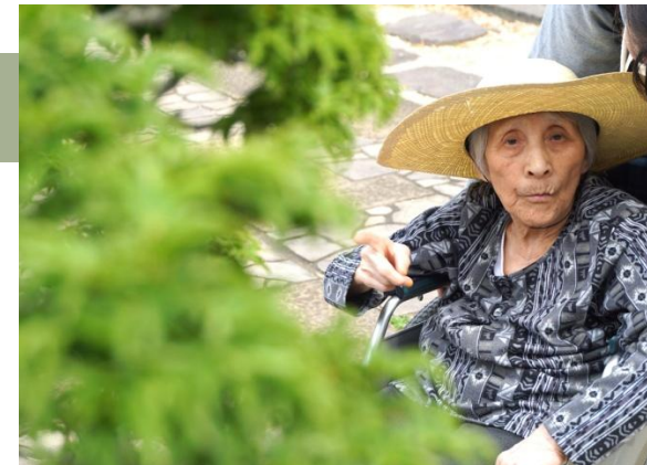
▲これが五葉松なの？