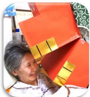
▲獅子っていうよりワンちゃんね?

手作りの獅子です。噛んでもらうと今年一年無病息災なので喜んで噛まれる方、普通に噛まれる方、お任せの方。大丈夫！今年も安泰ですよ。