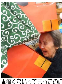
▲痛くないって言ったのに痛じゃないの!もう