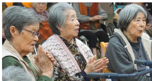
▲コーラスなら私たちに任せて