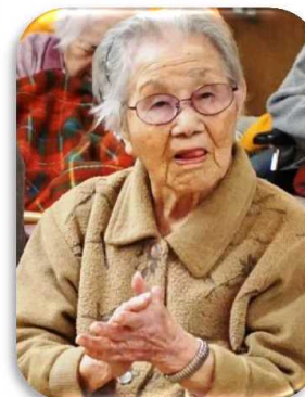
▲8ビートのノリでいかしら