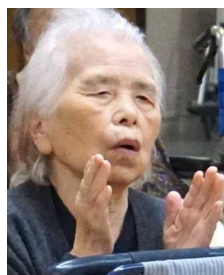
▲手拍子だって難いわ