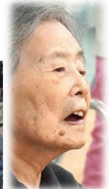
▲アー。発声練習からね