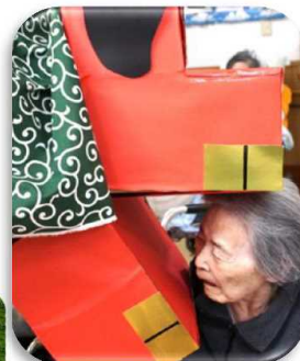
▲これ虫歯じゃない?