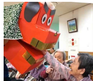
▲飼い獅子に手を噛まれたワン