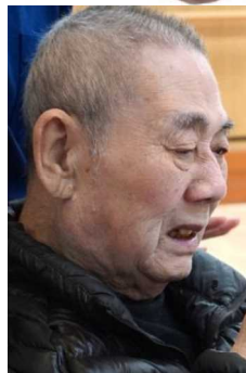
▲義理と人情、男の世界だぜ