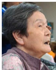
▲私にもマイク回して