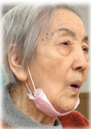
▲マスクじゃなくマイク貸して

獅子舞の後は、お楽しみ「のど自慢」開催。歳の初めにふさわしい楽曲を皆さんで歌いました。