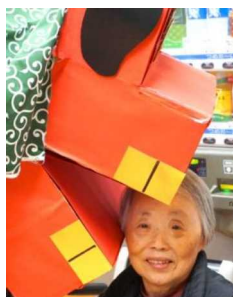
▲毎年のことだから慣れちゃったわ