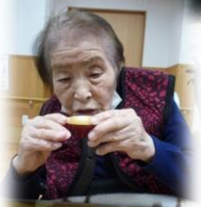
▲1月生まれの方には誕生日プレゼントも