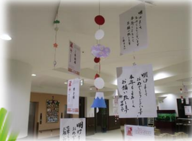
▲1F ラウンジに皆様の書道の作品が年賀状形式で飾られました