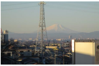
▲元日朝、屋上から撮影された富士山です