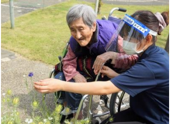
▲小さなお花見つけ

4年ぶりのバスハイクです 素敵な庭園のある緑水苑指扇 に出かけ、お花を愛で、子犬 と遊び、ACTメンバー伴奏で 歌を歌い、美味しいおやつを 頂いたりと盛りだくさんの ひとときでした。