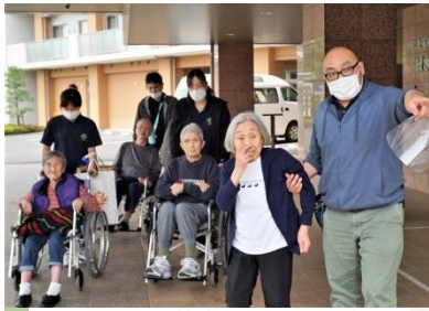
▲緑水苑指扇に到着▶