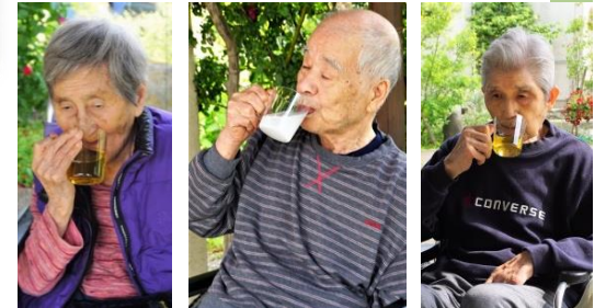
▲外で頂くと格別です