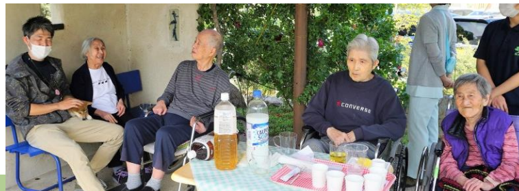
▲リラックスタイムです