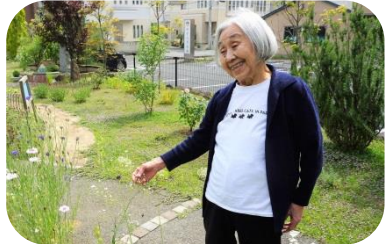
▲私みたい可愛い花が一杯