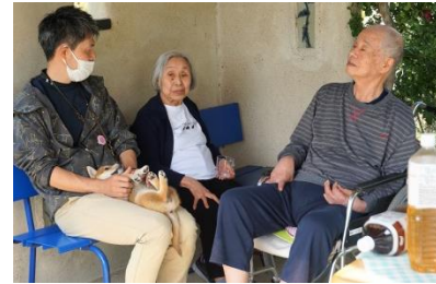
▲盆栽育てていらしたんですか