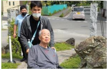
▲指扇の施設長です