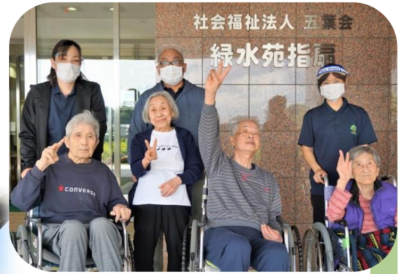
▲指扇のエンタランス前で記念撮影