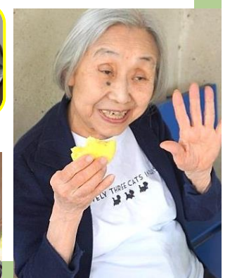
▲一段と美味しいわ