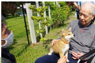
▲動物療法の新人犬なんです