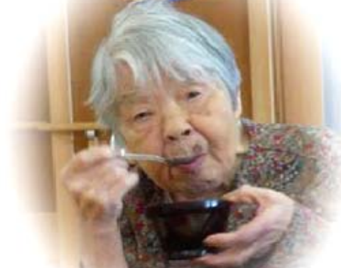
▲かるた取りを終わって お汁粉を召上がるご利用者様